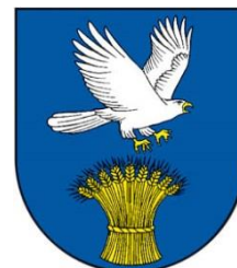
Obrázok 2 Erb obce

Erb obce Jastrabie pri Michalovciach tvorí v modrom štíte nad zlatým snopom strieborný obrátený prirodzený jastrab v zlatej zbroji.